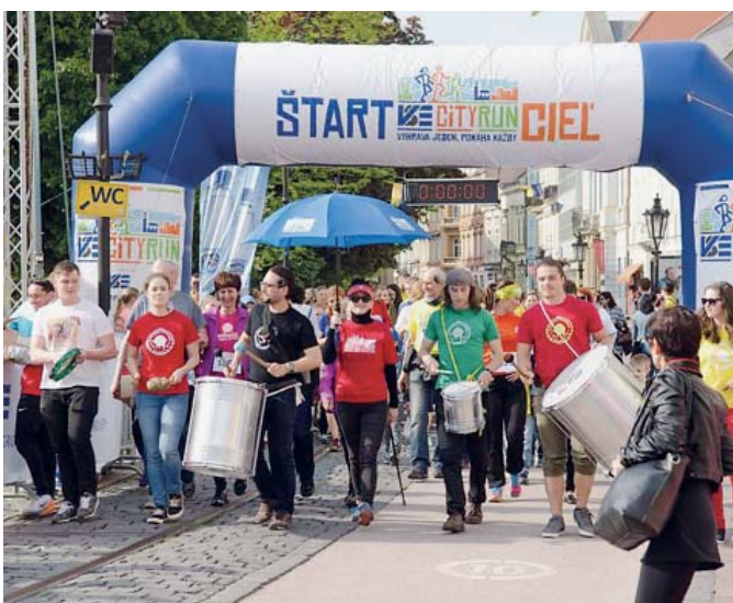
Tradiční hromadný běh ulicemi Košic v rámci akce VSE CITY RUN.

Tipy na výlety v letních měsících a další informace naleznete na www.kosice.sk a www.kosicezapad.sk