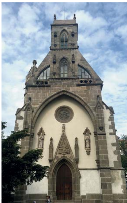
Kostel svatého Michaela archanděla

Největší slovenský kostel pocházející z období gotiky. Za prozkoumání stojí monumentální nástěnná malba i původní středověký nápis.