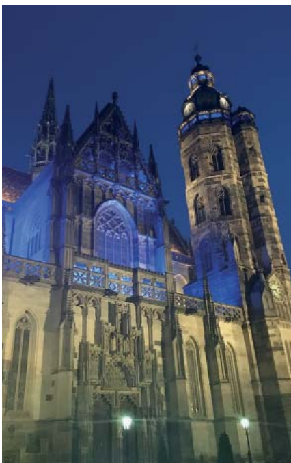
Katedrála svaté Alžběty Durynské

Největší slovenský kostel pocházející z období gotiky. Za prozkoumání stojí monumentální nástěnná malba i původní středověký nápis.