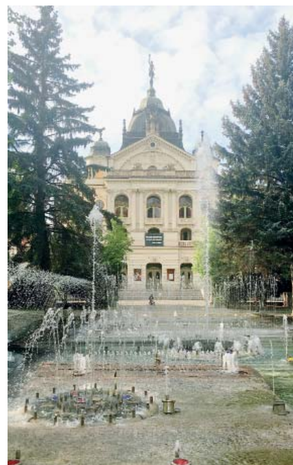
Zpívající fontána před Národním divadlem

Dříve pohřební kaple s kostnicí. Dnes kostel s vyobrazením archandělů na fasádě. Národní památka a nejlépe zrekonstruovaná stavba roku 2006.